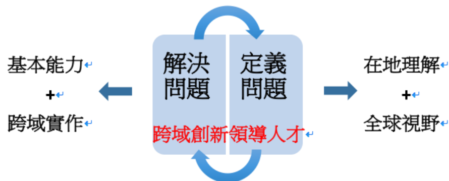
跨域創新領導人才培育架構

近二十年，世界的變化飛速，台灣的產業發展、環境問題、貧富差距問題日漸嚴峻，人們對於人才培育的期待愈甚。清華作為台灣的頂尖大學，自當積極回應社會的挑戰與期待，重新定義人才培育，突破過往以專業分工為主導的解決問題人才培育架構，積極培育跨域創新領導人才，不但具有解決問題的能力，並且能夠主動定義問題，開創台灣社會的可能性。